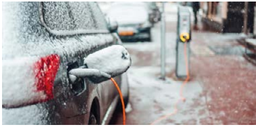
Abb. 3

Bei der Umsetzung schlagen die Fahrzeughersteller unterschiedliche Wege ein: