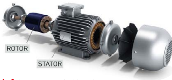
Abb. 1

Der Stator ist unbeweglich und erzeugt mit Hilfe von Wechselstrom ein variables Magnetfeld. Der drehbare Rotor besteht aus einem Permanentmagneten oder stellt sein Magnetfeld mit Gleichstrom her. Die beiden Magneten ziehen einander abwechselnd an und stoßen einander ab. Der Rotor dreht sich und diese Bewegung wird über ein Getriebe auf die Räder übertragen. Bei einem Elektromotor steht das maximale Drehmoment über einen vergleichsweise großen Drehzahlbereich zur Verfügung. Allerdings lassen sich Geschwindigkeiten von 0 bis über 200 km/h nicht nur mit der Motordrehzahl verwirklichen. Zur Umsetzung braucht es ein Getriebe. Aber anstelle eines Getriebes mit 4 bis 10 Gängen wird nur ein ein- oder zweistufiges Getriebe zur Überdeckung des gesamten Geschwindigkeitsbereiches benötigt.