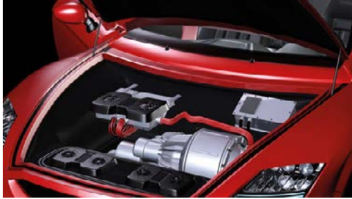
Abb. 4