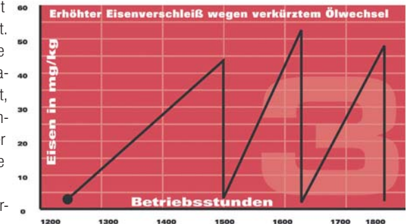
Abbildung 3: Auch der dritte Fall kann bei mangelnder Information schnell auf die falsche Fährte führen. Bei der Gesamtlaufzeit von 1.625 Stunden wurde eine Probe analysiert. Diese Probenahme erfolgte allerdings nur 123 Stunden nach dem vorherigen Ölwechsel. Dabei wurden 55 mg/kg Eisen in der Ölprobe nachgewiesen. Im Vergleich zum vorhergehenden Beispiel erscheint der Wert von 55 mg/kg nicht besorgniserregend.

Würde hier die Öleinsatzdauer aber nicht angegeben, dann würden diese 103 mg/kg Eisenabrieb oberhalb des üblichen Limits liegen und sehr hoch aussehen. Dies würde eventuell eine zu harte oder gar falsche Diagnose nach sich ziehen, denn unter der Betrachtung der gesamten Laufzeit hat keine abnormale Abnutzung stattgefunden, sondern das Öl ist einfach später als angenommen gewechselt worden.