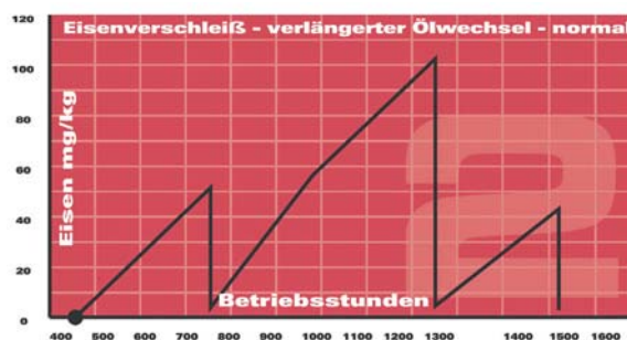
Abbildung 2: Im zweiten Fall wurde der bei 1.000 Betriebsstunden fällige Ölwechsel nicht durchgeführt. Als der Service nach einer Laufzeit von 1.253 Stunden nachgeholt wurde, war das Öl letztendlich 493 Stunden im Gebrauch. In der Ölprobe wurden 103 mg/kg Eisen gemessen. Ein relativ normales Ergebnis für die nahezu verdoppelte Einsatzdauer des Öles.

Würde hier die Öleinsatzdauer aber nicht angegeben, dann würden diese 103 mg/kg Eisenabrieb oberhalb des üblichen Limits liegen und sehr hoch aussehen. Dies würde eventuell eine zu harte oder gar falsche Diagnose nach sich ziehen, denn unter der Betrachtung der gesamten Laufzeit hat keine abnormale Abnutzung stattgefunden, sondern das Öl ist einfach später als angenommen gewechselt worden.